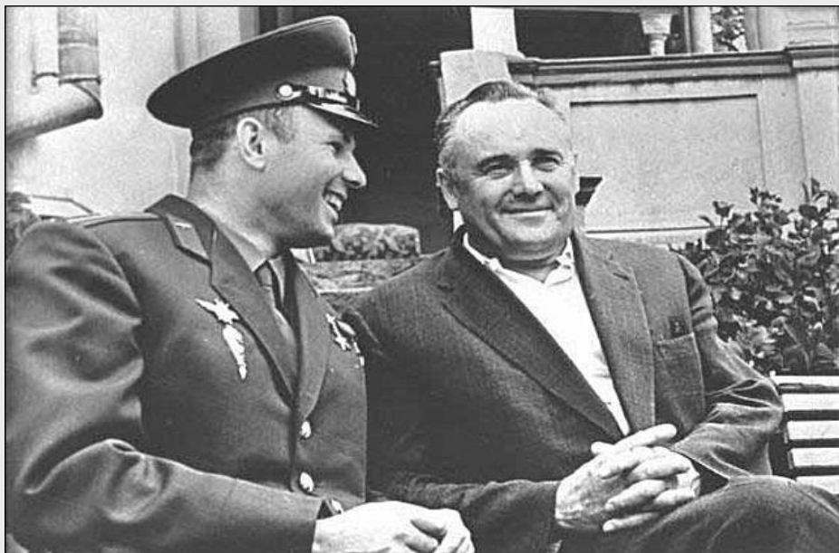
Ю.А. Гагарин и С.П. Королев